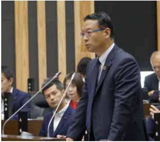
長崎県議会 9月定例議会 一般質問

杵岐島はじめ離島振興等について大石知事、教育委員会教育長、各部長へ一般質問をさせていただきますので、報告申し上げます。